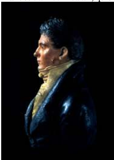
Busto de James Hoban, arquitecto de la Casa Blanca | Crédito:

Entre los presentes, además de los comisionados del distrito federal y los curiosos de Georgetown y poblaciones vecinas, se encontraba el arquitecto del edificio, el irlandés James Hoban , quientambién era un hermano masón.