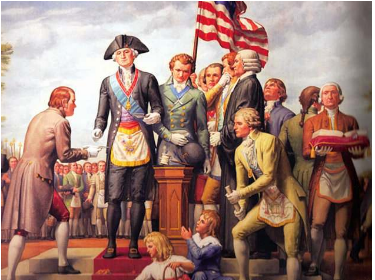
Washington colocando la primera piedra del Capitolio, ataviado con ropas masónicas.

Menos de un año después de la llamativa ceremonia de fundación de la Casa Blanca, la escena volvió a repetirse en el solar del Capitolio . El 18 de septiembre de 1793 , un grupo de personas, entre ellas numerosos miembros de varias logias masónicas, desfilaron solemnemente hasta el lugar elegido.