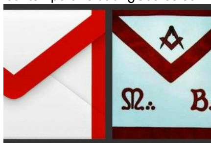
Izquierda: Símbolo de Gmail.

Los masones, tal y como actualmente se les conoce, provienen de los "constructores libres" medievales que estaban exentos del impuesto de franquicia y que, por tanto, podían viajar libremente.