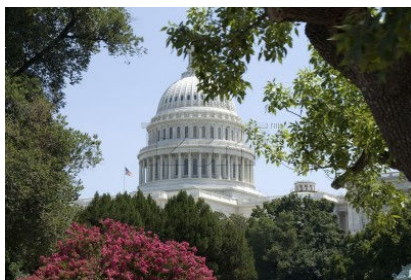
La cúpula desde el exterior y a la derecha, el piso interior.

Ceres, la diosa de la agricultura, se muestra con una corona de trigo y una cornucopia, sentada en una segadora McCormick. La nueva América con un gorro frigio (que simboliza la Libertad), sostiene las riendas de los caballos. En primer plano, Flora (diosa de las flores), recoge flores.