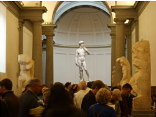
Galería de la Academia de Florencia