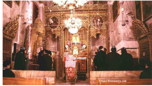
Monasterio Ortodoxo de San Marcos, Jerusalén